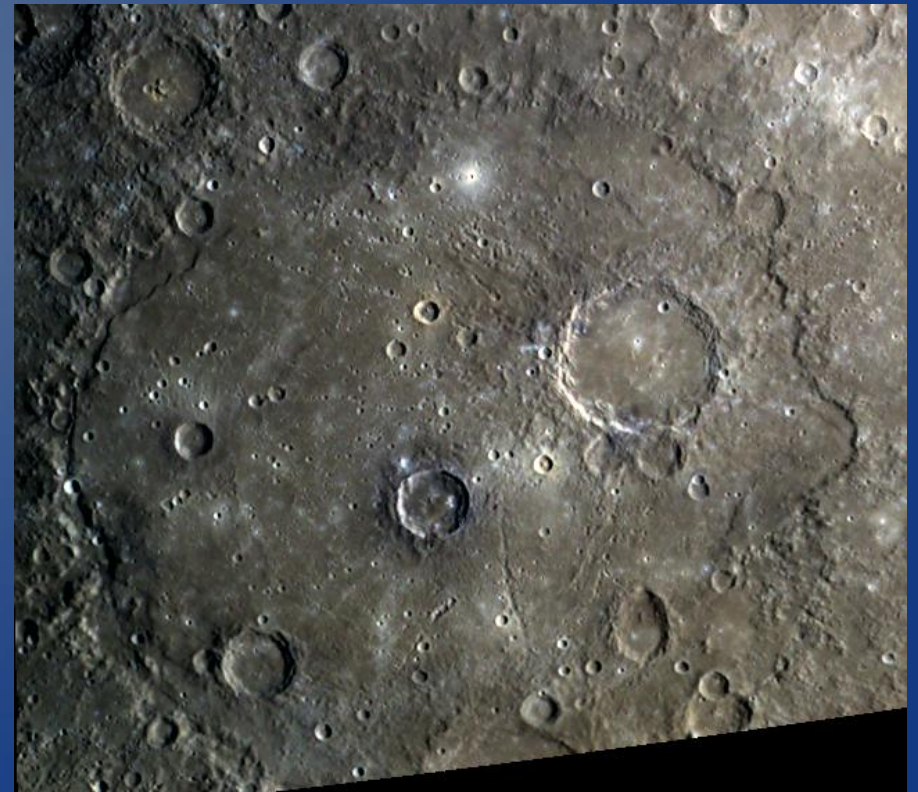
zweitgrößter Krater: Beethoven