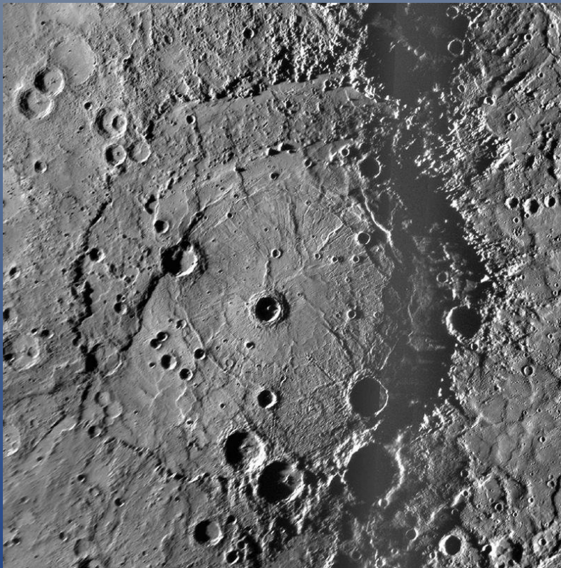
größter Krater: Rembrandt